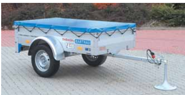
QL 751 mit Zubehör: Flachplane, serienmäßig in hellgrau, andere Farben gegen Mehrpreis lieferbar.