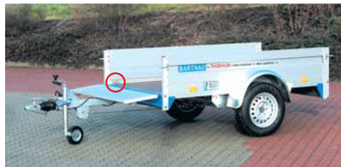
QL 1001 : Vordere und hintere Bordwand abklappbar.