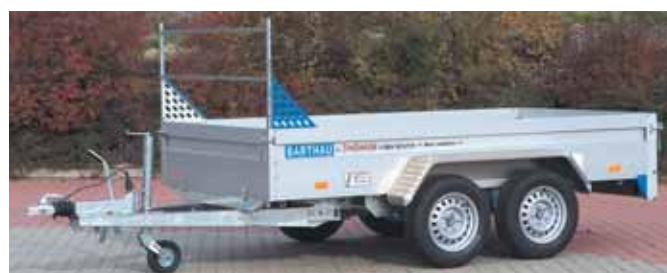
QL 2702 mit Zubehör: H-Galerie 600mm hoch gesichert mit Lochblechen gegen unbeabsichtigtes Herausziehen oder Kippen. Das obere Rohr ist drehbar gelagert und paßt sich der Ladung an. Aluminium-Riffelblechkotflügeln statt Blechkotflügeln.