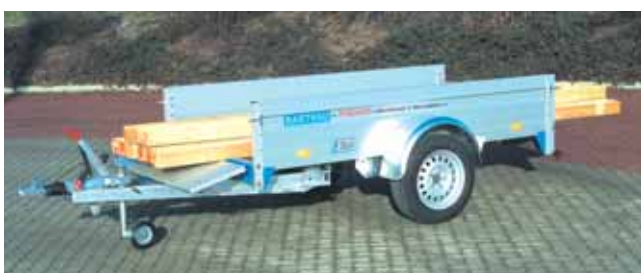
QL 1351 beladen: Vordere und hintere Bordwand abgeklappt.

Der Lastenträger ist über die Ladungssicherung TOPZURR24 befestigt und kann so kinderleicht auf- und abmontiert werden, ohne den Anhängerboden zu beschädigen. Zum Fahrradtransport ist der Fahrradträger auf den Lastenträger aufgesetzt. Maximal 5 Fahrräder finden darauf Platz.